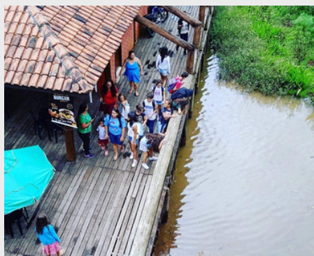
Visita ao Parque Tanguá com as crianças e adolescentes das comunidades Vila Nova, Tabuleiro e Bom Sucesso - Atividade sobre PANCs (Plantas Alimentícias não convencionais) - 2022.