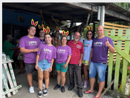
Páscoa Solidária - Extensionistas, motorista e Líder Comunitário na comunidade Currais - 2024.