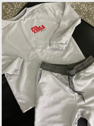
Agasalhos confeccionados pelas alunas extensionistas para as pessoas em situação de rua e coletores de recicláveis - 2021.