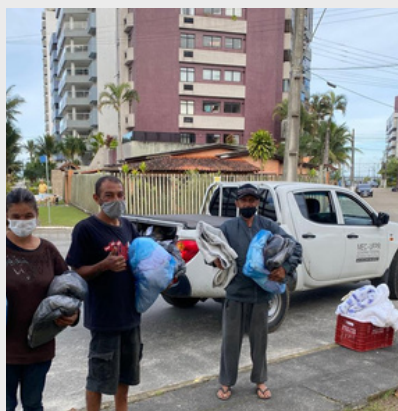
Pandemia - Distribuição de roupas e cobertores às pessoas em situação de rua - 2020.

A Lei nº 13.005/2014 justifica a creditação da Extensão universitária ao reconhecer sua importância na integração entre Ensino, Pesquisa e as necessidades da comunidade.