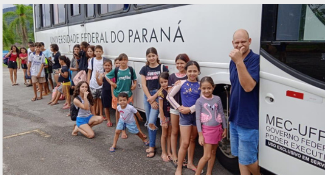
Visita ao Parque Águas Claras com as crianças e adolescentes da Rede Solidária - Temática abordada: A importância da Mata Atlântica - 2025.

As atividades são planejadas com base nas demandas reais das comunidades em situação de vulnerabilidade e contam com o apoio de instituições parceiras fundamentais, como a Associação Vila Nova, a Rede Solidária de Matinhos, a Associação de Moradores do Perequê, o Instituto O Pai Me Adotou e o Instituto Aprova. Juntas, essas parcerias ampliam o alcance das ações e fortalecem a rede de solidariedade e transformação social na região.