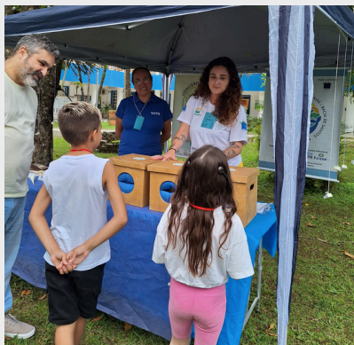
Evento Dia da Crianças - Atividade de Educação Ambiental do Projeto Coalizão pela década do Oceano - 2024.