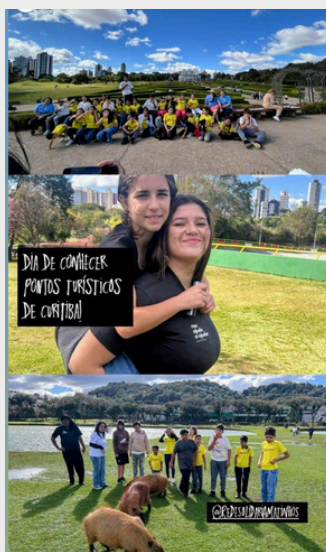
Visita ao Jardim Botânico e Parque Barigui (Curitiba, PR) com as crianças da Rede Solidária - 2025