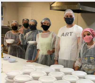
Confecção das marmitas na Pandemia - 2020.

E, venhamos e convenhamos, nem todo mundo se importa com a realidade social da população, concordam?