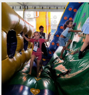
Lazer no Evento do Dia das Crianças - 2024.

SAIBA MAIS SOBRE NOSSAS AÇÕES NO INSTAGRAM: @PROJETO.MATINHOS