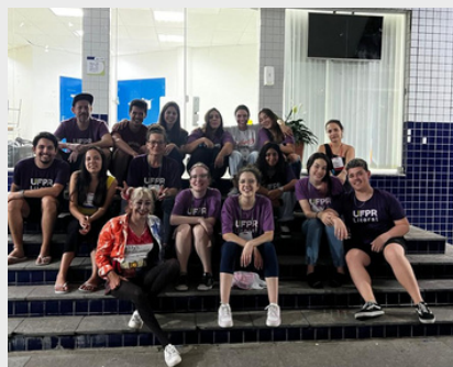
Equipe de Extensionistas - 2024.