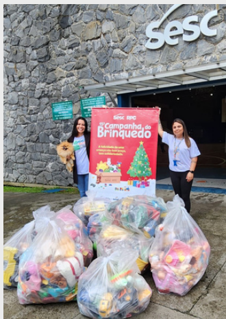
Dia das Crianças - Doação de brinquedos pelo SESC - 2022.