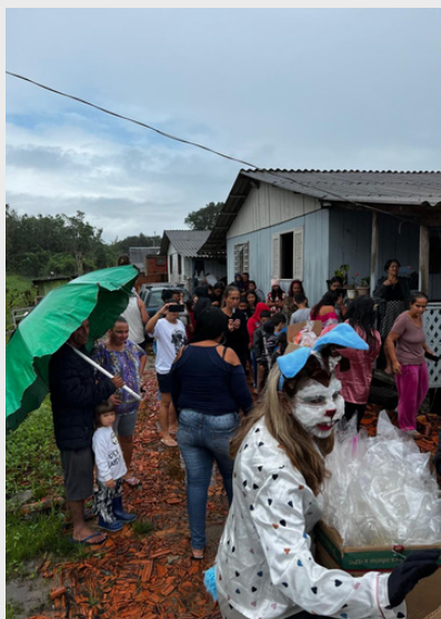
Páscoa Solidária - Comunidade Vila Progresso - 2022.