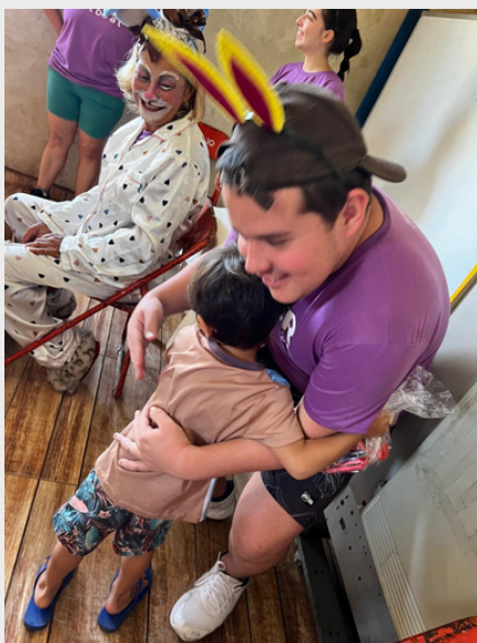
Páscoa Solidária - Associação de Moradores do Perequê - 2023.