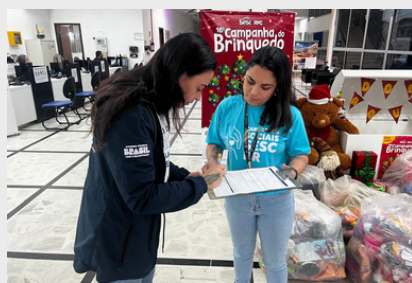
Doação de brinquedos do SESC Caiobá - 2024.