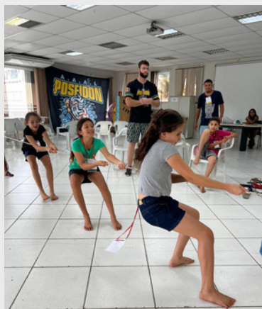
Evento Dia das Crianças - atividade de esporte e lazer promovida pela Atlético Poseidon - 2023.