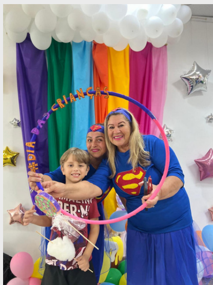
Liderança Comunitária do Balneário Albatroz - Evento Dia das Crianças - 2024.