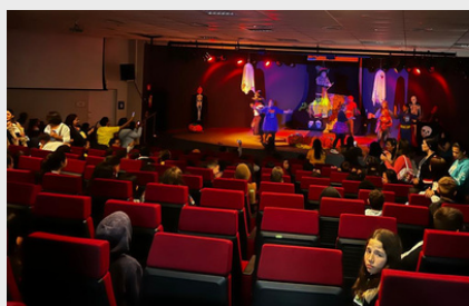
Peça teatral "Os Saltimbancos" da Cia de Teatro PalavraAção - 2024.