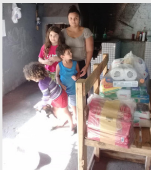
Distribuição de alimentos - Comunidade Rio da Onça - 2021.