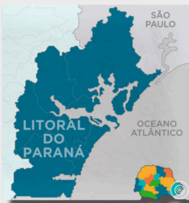
Mapa: Programa Rebimar

A pandemia agravou a situação de milhares de famílias em situação de vulnerabilidade no litoral paranaense, destacando a necessidade de ações contínuas e integradas para mitigar os efeitos da pobreza e da insegurança alimentar.