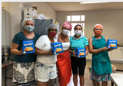
Equipe da Associação Vila Nova e Coordenadora do Projeto após a preparação da Ceia de Natal para as pessoas em situação de rua - 2021.