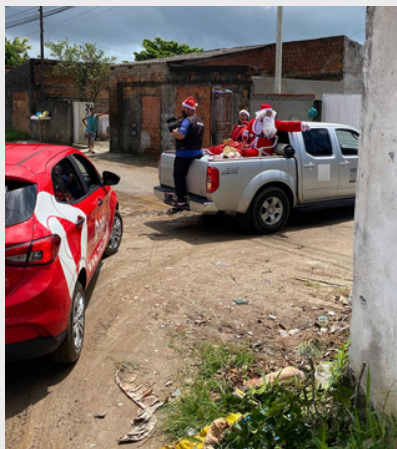
Distribuição de Presentes de Natal nas comunidades de Matinhos, Guaratuba e Paranaguá com a cobertura da TVCI - 2022.