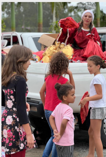
Natal Solidário - Distribuição de Presentes na Colônia Pereira em Paranaguá - 2022.

A extensão universitária, ao promover o intercâmbio entre saberes acadêmicos e populares, contribui diretamente para a formação cidadã dos estudantes e para o fortalecimento das comunidades em situação de vulnerabilidade.