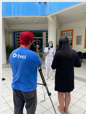
Entrevista sobre as ações do Projeto durante a pandemia - 2020.