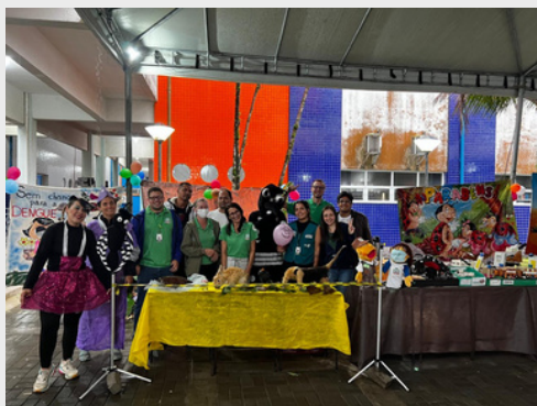
Atividade educativa com a Secretária de Saúde de Matinhos sobre a Dengue - 2023.