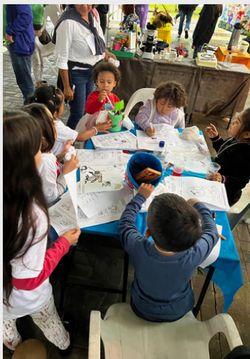
Dia das Crianças - Oficina de desenho do Mundo Mágico da Leitura - 2024.

Essas colaborações ampliam o impacto das ações, promovendo uma abordagem interdisciplinar e integrada que valoriza o território, a cultura local e o protagonismo comunitário. Juntas, essas iniciativas constroem uma rede de solidariedade, conhecimento e transformação social no litoral paranaense.