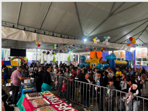
Evento Dia da Crianças- Evento com as crianças das 11 associações de moradores de Matinhos e Guaratuba - 2023.