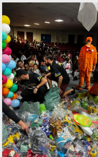
Dia das Crianças 2023 - Atividade com a Atlético Poseidon

Dada a insuficiência das políticas públicas, o papel da universidade e dos estudantes extensionistas é fundamental para colaborar com a transformação social, ajudando a construir uma sociedade mais justa e sustentável, em consonância com os ODS.