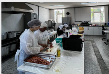
Preparação da alimentação para o evento do Dia das Crianças - 2024.

É indissociável ao Ensino e a Pesquisa, mesmo assim é a menos valorizada da tríade, carrega o estigma de não ter o mesmo status da Pesquisa, talvez por se tratar da face social da Universidade e por sofrer com a falta de financiamento.