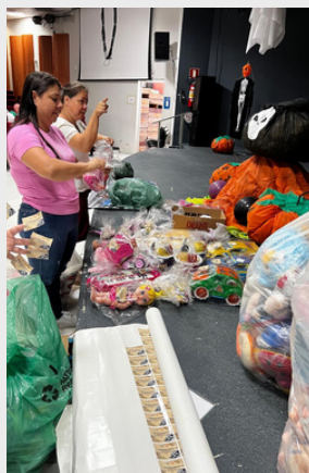
Líderes comunitárias na organização da apresentação do Evento Convenção das Bruxas - 2023.