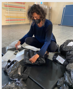
Extensionista separando os Kits de roupas da Campanha de Inverno para as pessoas em situação de rua - 2020.