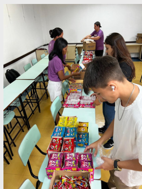
Páscoa Solidária - Extensionistas preparando as cestas - 2023.

Feedback constante é colhido das comunidades para adaptar as ações às suas necessidades emergentes.