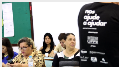
Produção do documentário do projeto com as lideranças comunitárias - 2025.