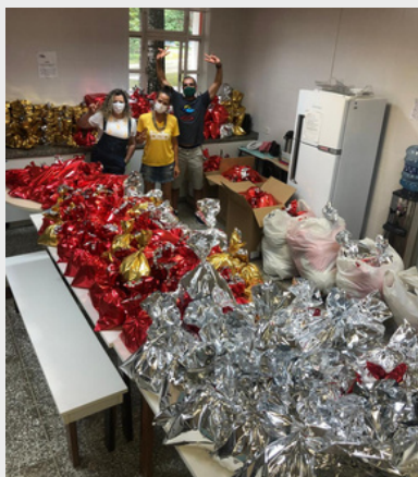
Organização do Natal Solidário - 2022.