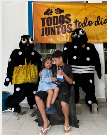
Atividade lúdica com a Secretária de Saúde sobre epidemiologia - 2024.

A Extensão está diretamente relacionada aos Objetivos de Desenvolvimento Sustentável (ODS) ao promover a integração entre o conhecimento acadêmico e as necessidades da sociedade, contribuindo para o desenvolvimento social, econômico e ambiental.